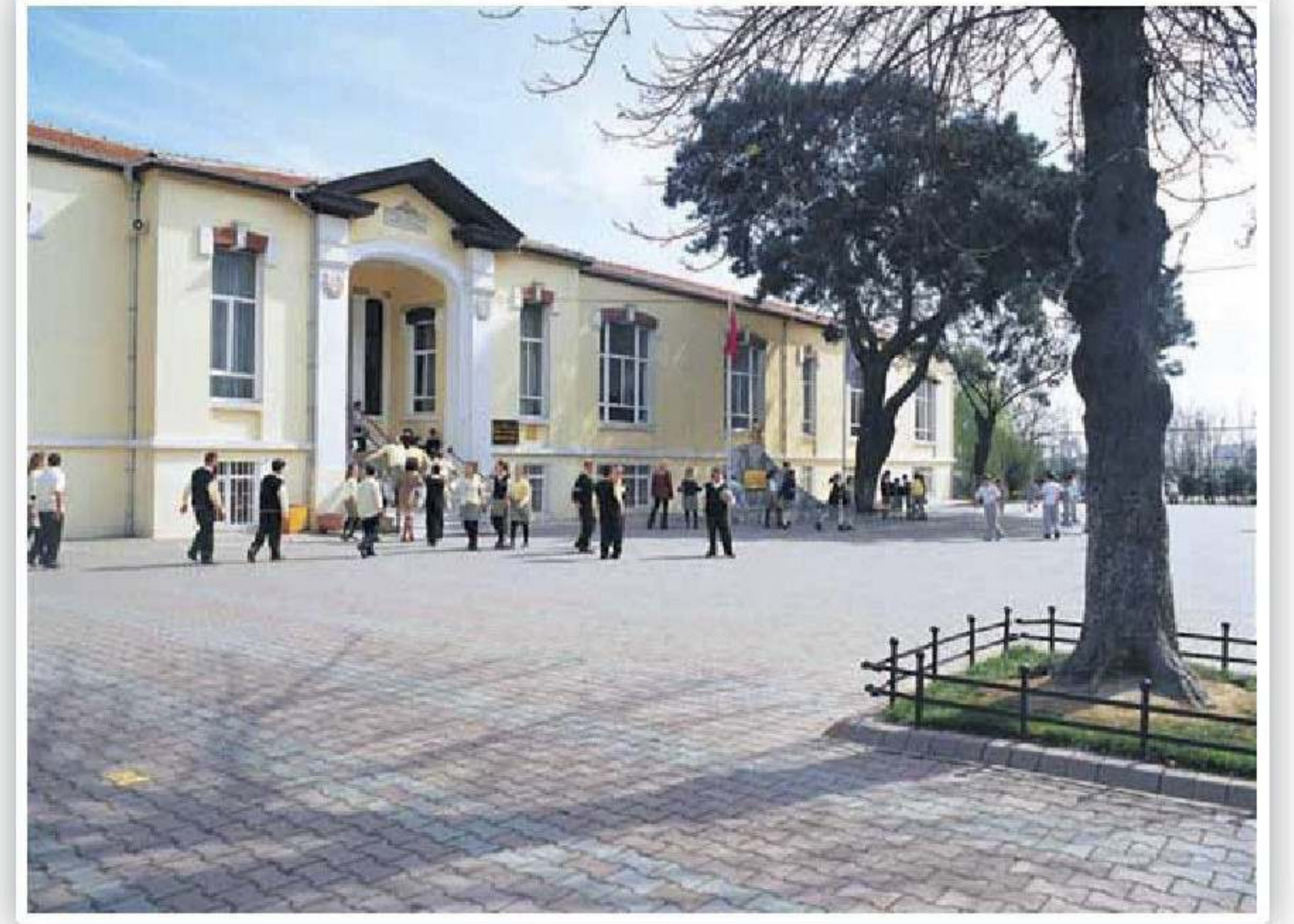
Avrupa Koleji Kazlıçeşme Kampüsü

eğitimle mümkündür. Teknolojik ve bilimsel gelişmeler ve küreselleşme insanlara "dünyanın artık çok küçüldüğünü" göstermektedir. Çağdaşlaşma ve çağı yakalama hedefinde olan Türkiye'de yarının dünyasında gerçekçi eğitimden faydalanan Türk çocukları ve gençlerinin etkin olabilmesi için dünyadaki bu gelişmeleri çok iyi görebilmesi gerekmektedir. Bu noktada, Avrupa Okulları'nın eğitim felsefesi de bu gerçek üzerine kurulmuştur. Bu kurumların eğitimdeki misyonu öğrencilerine kendi ulusal kültürlerini özümsettikten sonra Almanca ile Avrupa kültürünü, İngilizce ve İspanyolcayla da dünyanın diğer kültürlerini öğretmektir. Burada amaç öğrencinin çift kültürde, daha geniş yelpazede yetişmesini sağlamaktır. Böylece ileride başka kültürleri anlamakta ve onlarla birlikte yaşayabilmekte güçlük çekmeyeceklerdir. Yani bir dünya insanı olarak topluma katılacaklardır. Küresel dostluklar, kültürleri karşılıklı öğrenmekle ve saygı duymakla oluşabilmektedir. Böylece, Avrupa Okulları, "üç dilde, çok kültürde öğrenci