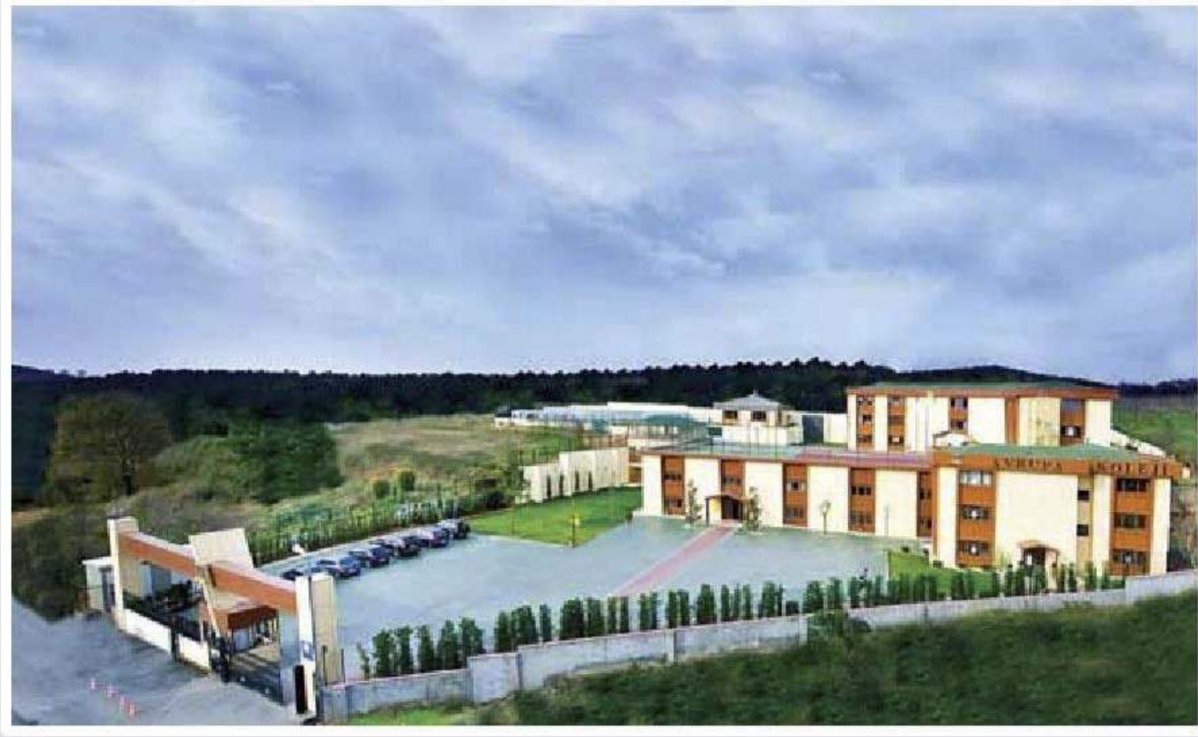
Avrupa Koleji Çekmeköy Kampüsü