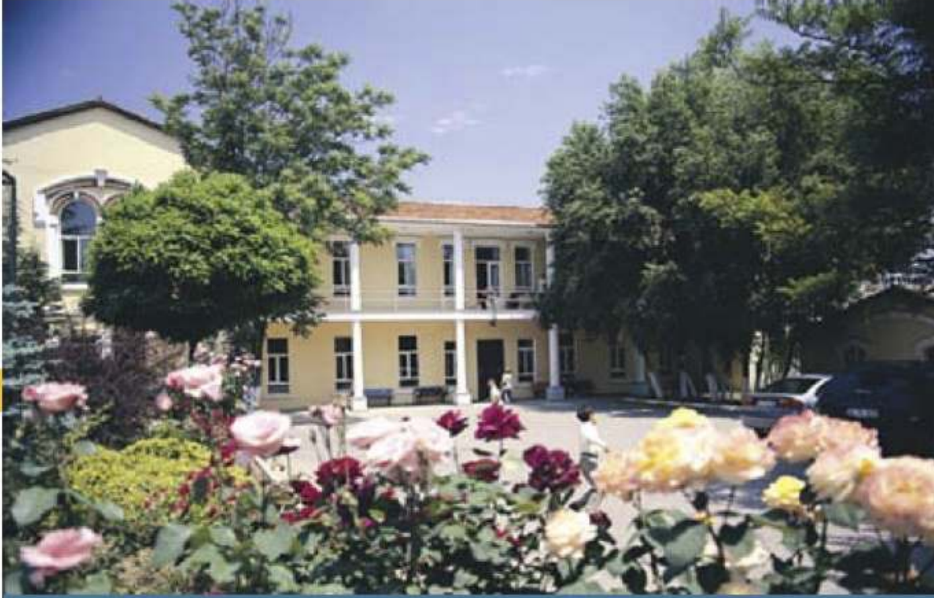
Avrupa Üniversitesi'nin yerleşkesi için Kazlıçeşme'de Marmaray istasyonu yanındaki 25 bin metrekare arsa içerisinde bulunan tarihi binanın restorasyon çalışmalarına başlandı.